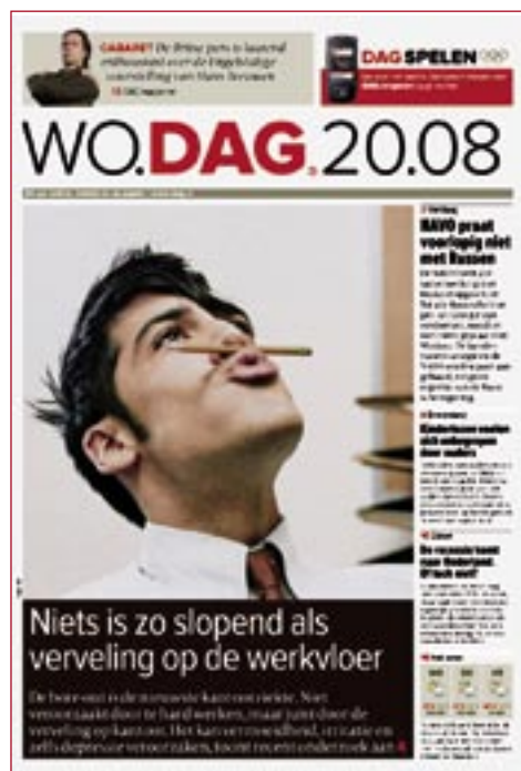
DAG krant met het beste humeur van Nederland.

De distributie is dus een factor die bij gratis kranten van groot belang, of misschien wel hét belangrijkste is!