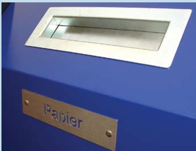
Inwerpunit en fractie-aanduiding van roestvaststaal